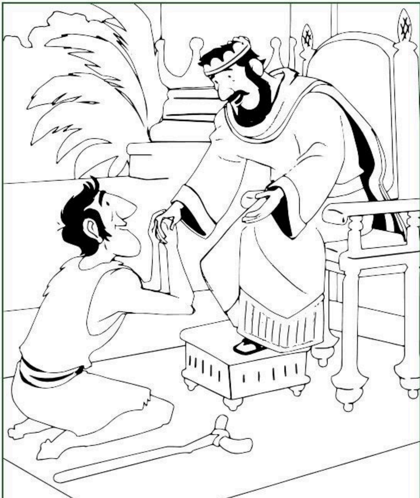
David and Mephibosheth